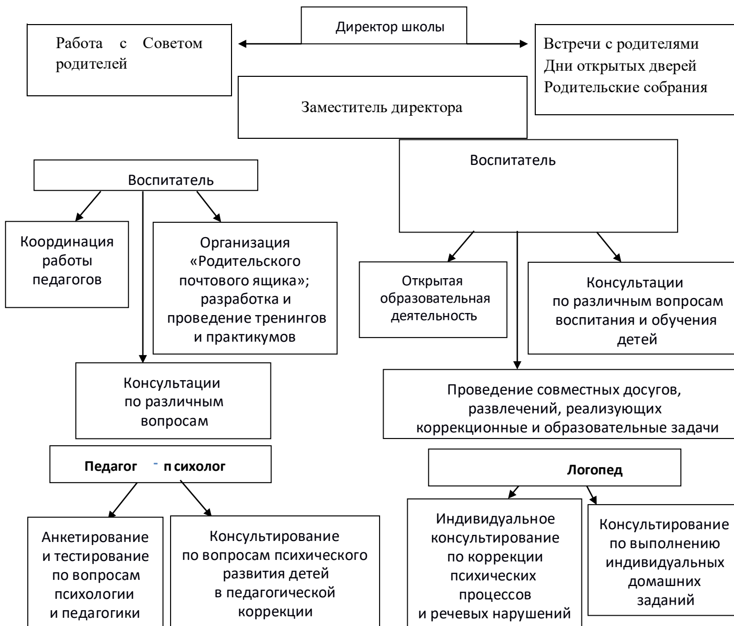
Рис. 1 «Схема взаимодействия с семьями воспитанников»