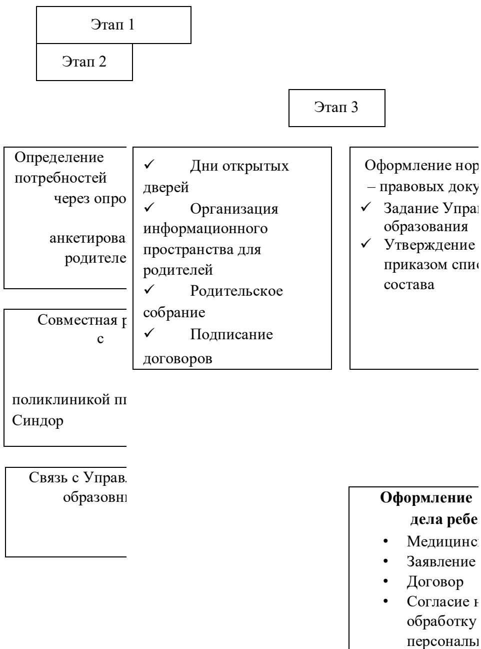
Рис. 3. «Этапы организации детей КМП»

С целью изучения степени удовлетворенности родителей качеством образовательных услуг консультационно – методического пункта, предоставляемых дошкольным образовательным учреждением, условиями пребывания их детей в